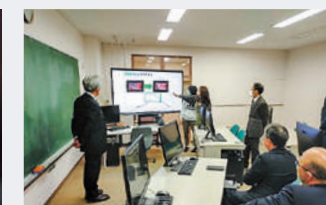
中間報告会では学生が遠隔撮影のデモンストレーションを行った