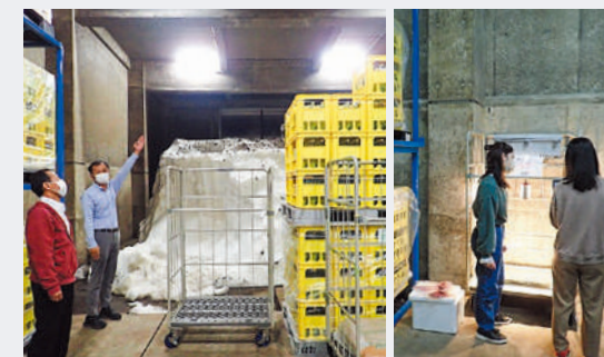
上越市安塚にある雪室内の様子

県内の産業界・行政機関と連携し、デジタル教育設備を活用して、高度なデジタルスキルと実践力を修得するための演習・実習によるデジタル×専門分野融合型の教育プログラムを実施しています。