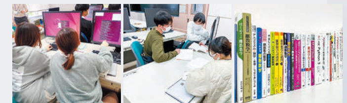
計算サーバ演習室でのLinux操作や専門書輪読の様子と演習室内の専門書

分野横断的な業務で必要となるコンピュータ利用のための知識やLinuxの利用技術、Pythonによるプログラミング、経済マーケティング分野や食品科学や保健分野におけるデータ分析、データによる国際紛争の分析など専門分野の教育にもデータサイエンスが取り入れられ、本学ならではの学習や研究が可能。