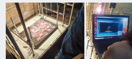
雪室内の牛肉・豚肉をハイパースペクトルカメラ(HSC)で撮影する