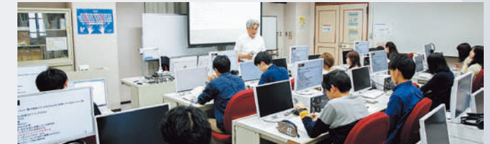
コンピュータ演習室での演習の様子

コンピュータの基本的な使い方についてのスキルを身に付けるための講義と文章作成、表計算・グラフ作成、プレゼンテーション資料作成などの演習を行う。