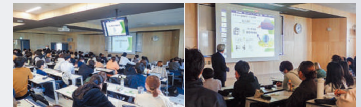
データサイエンスリテラシー対面講義の様子

令和4年度後期より開講した「データサイエンスリテラシー」は200人以上が履修履修理由としては、「将来、仕事で必要になるかもしれない」(47%)、「データサイエンスに興味があった」(22%)、「農業や高齢者福祉などの一見ITとは関わりがなさそうな分野でデータを利用していることにおどろいた」、「世の中は自分が思っている以上にデータで管理・分析されていることが分かった」(履修者へのアンケートより抜粋)