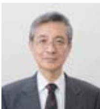
新潟県立大学 学長 猪口 孝

日本経済を支える企業や社会で活躍する人材をいかに輩出していくかは、日本にとって重要な課題です。グローバル化が叫ばれて久しくなりますが、日本はいまだに鎖国時代の徳川モデルが生きています。つまり、日本の社会でしか通用しないことを学生に学ばせるので、日本の外では学んだことが通用せず、活躍できる人材がなかなか育てていないのが現状です。